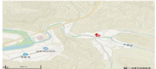
경북 안동시 남선면 원림리 596 3,512m 2