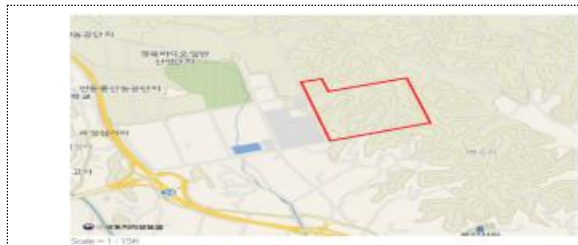
경북 안동시 풍산읍 매곡리 산 17 일원 (경북바이오2차일반산업단지) 299,324m 2