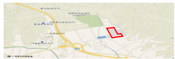
경북 안동시 풍산읍 매곡리 1137번지, 1138번지 및 1139번지 (경북바이오산업연구원 및 분원) 39,779.4m 2