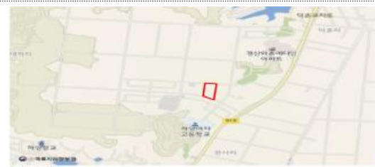
경북 경산시 하양읍 대학리 1091 (경북테크노파크 메디컬융합소재실용화센터) 16,528.9m 2