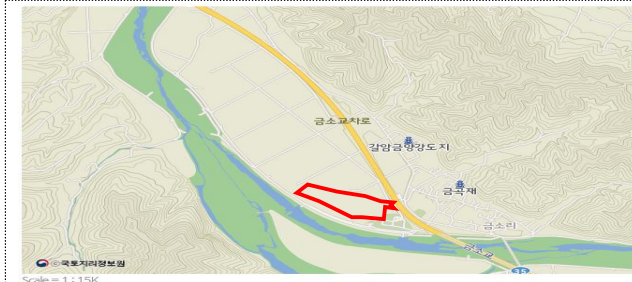
경북 안동시 임하면 금소리 일원 (안동포전승교육관 및 안동포문화공원 일원) 33,002m 2