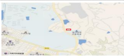
경북 경산시 갑제동 440-22 일원 (한국한의약진흥원) 2,570.19m 2