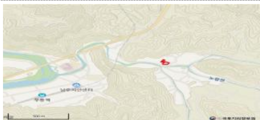
경북 안동시 남선면 원림리 596 3,512m 2

8. 관련 자료의 열람방법 : 관련 자료는 경상북도 과학산업국(Tel : 054-880-2511, www.gb.go.kr)에서 열람할 수 있음