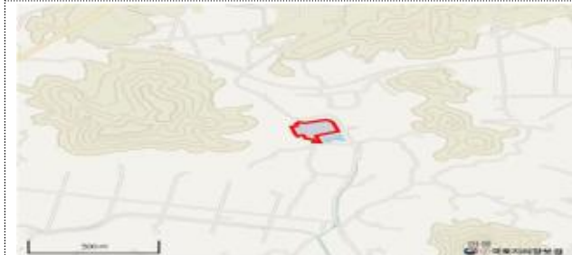
경북 안동시 풍천면 도양리 1272 일원 26,353m 2

8. 관련 자료의 열람방법 : 관련 자료는 경상북도 과학산업국(Tel : 054-880-2511, www.gb.go.kr)에서 열람할 수 있음