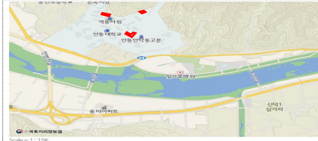
경북 안동시 경동로 1375 안동대학교 616.45m 2